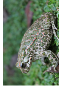
Bufo balearicus (Rospo smeraldino), ottimo divoratore di insetti infestanti

Da sempre appassionato di natura e di sostenibilità, studia da anni le tecniche e i principi alla base dell'orticoltura e del giardinaggio ecologici, in grado di fornire cibo di qualità e rifugi per specie animali e vegetali selvatiche, trasformando qualunque pezzo di terreno in un santuario della biodiversità. Autore o co-autore di diverse conferenze a tema sull'argomento.